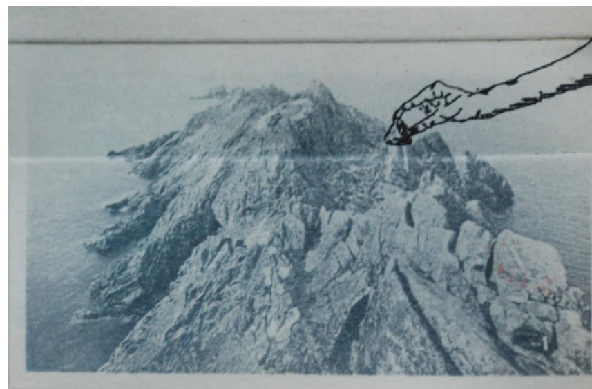
(detalhe) gravura em metal sobre fotografia apropriada

paisagem para viagem - imposição de mares