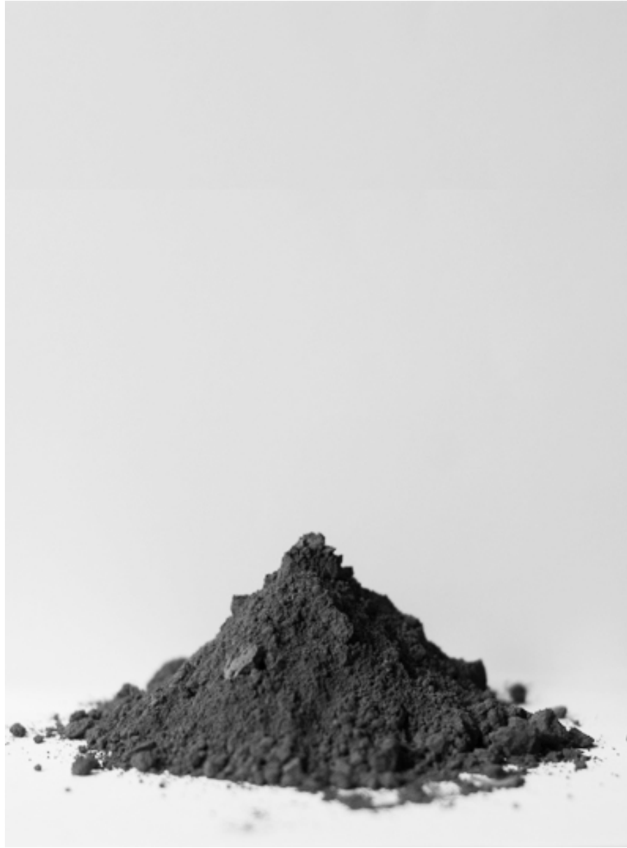
sem título 2016 diptico - fotografia digital 70 cm x 40 cm