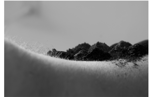
sem título 2016 tríptico - fotografia digital 30 cm x 120 cm